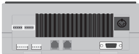
Coup d'œil sur le nombreux connecteurs

Possibilité de connexions de beaucoup d'accessoires.