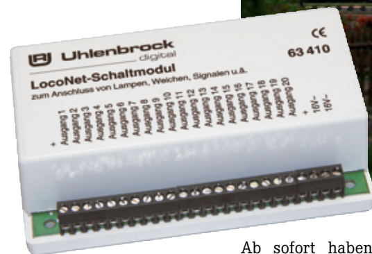
Das LocoNet-Schaltmodul 63410 - „Eines für Alles!“...

Ab sofort haben es alle Besitzer einer LocoNet-Digitalzentrale, wie z. B. der Intellibox und baugleichen Zentralen, einfacher. Sie benötigen nicht mehr diese Vielzahl unterschiedlicher Bausteine, sondern lediglich das Uhlenbrock LocoNet-Schaltmodul 63410, das auch in der Lage ist, mehrere unterschiedliche Schaltaufgaben (Moment- und Dauerkontakt) parallel auszuführen. Das LocoNet-Schaltmodul wird über ein einziges beiliegendes LocoNet-Kabel mit der Zentrale oder anderen digitalen LocoNet-Bediengeräten verbunden. Die Verbraucher (Weichen, Lampen, u.a.) werden direkt an das Modul angeschlossen und erhalten von einem an das LocoNet-Modul angeschlossenen Trafo ihren Strom. Damit belasten Verbraucher, die über das Schaltmodul versorgt werden, nicht den digitalen Fahrstrom von Zentrale oder Booster. Das LocoNet-Schaltmodul hat 20 Ausgangsklemmen für 20 unterschiedliche Verbraucher.