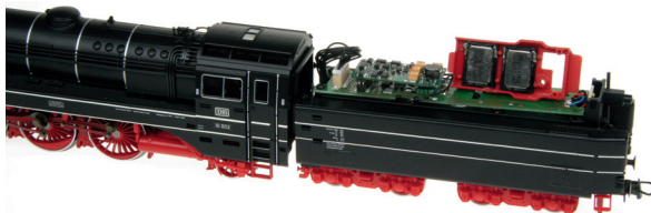
Bild oben: Hier wird der Tender einer BR 10 der Spurweite H0 mit vorinstallierter Halterung für die Miniaturlautsprecher 31102 genutzt.

Bild oben: Der obere Teil des Führerstandes einer V 200 der Spurweite N dient als Resonanzraum. Die Lautsprechermembrane des Miniaturlautsprechers 31101 strahlt dabei nach unten zum Drehgestell ab.